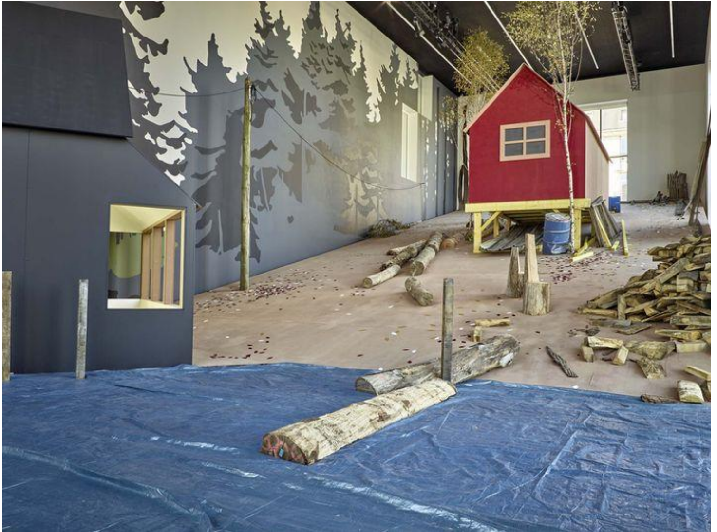
Alain Bublex (1961-), Un paysage américain (générique) , 2019/2020, diorama à échelle 1 inspiré du générique du film Rambo (First Blood) (Rambo (Premier sang)) de 1982. Nef du centre de création contemporaine Olivier Debré, Tours.