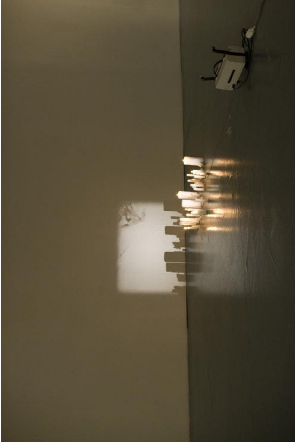
Badr El Hammami (1979-), sans titre , 2012, installation, projecteur super 8, bougies. Galerie de théâtre de Privas, centre d'art contemporain.