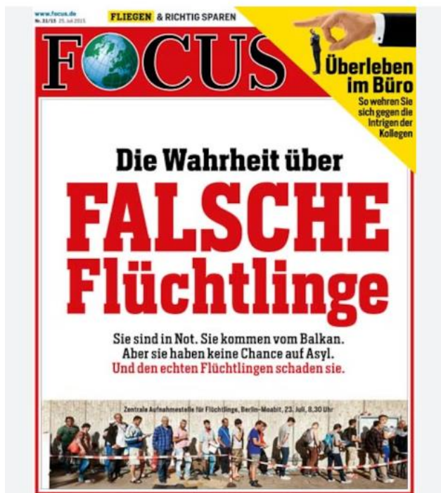
Source : Focus, 27.07.2015