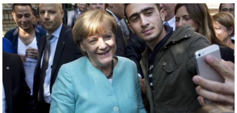
Ein kleines Wort und seine große Bedeutung : In Stunden der Not wusste Angela Merkel Gemeinschaft zu stiften. Mit dem Satz : « Wir schaffen das. »