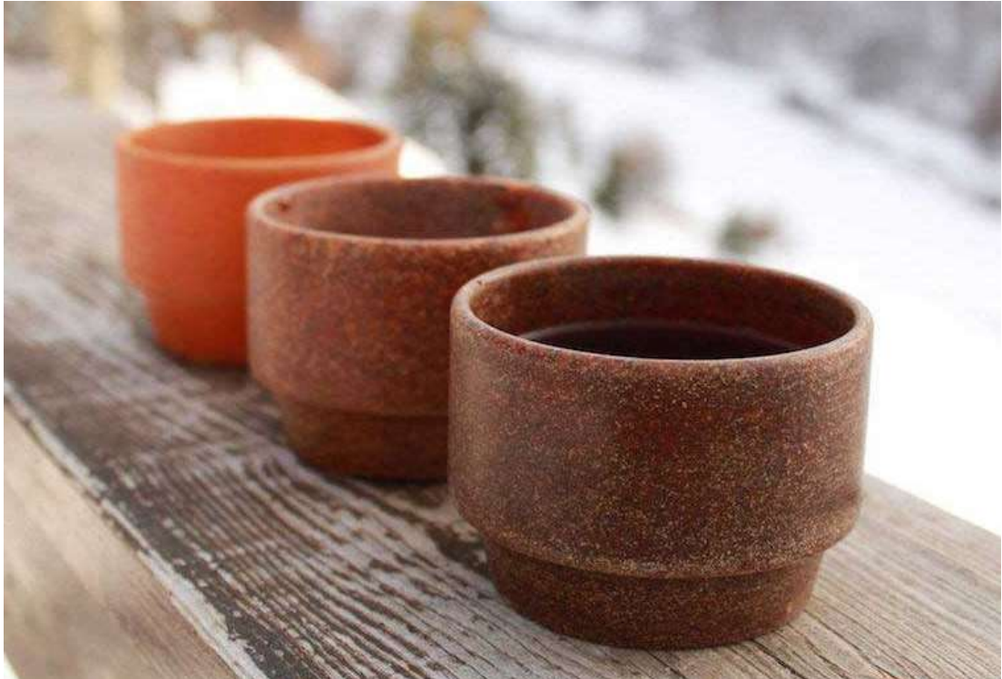
Victoria Lièvre , designer, Repulp , gobelets à base de déchets d'agrumes compressés, Marseille, 2020.