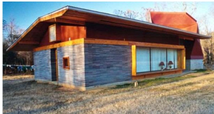
Rural Studio , architectes, Lucy Carpet House , résidence privée, Masons Bend, États-Unis, 2002.