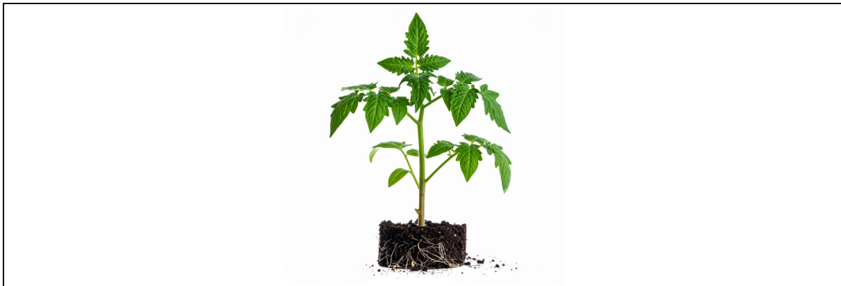
Document 5 – plant de tomate

Décrire dans l'ordre les étapes de développement permettant la formation de tomates sur un plant dont l'état est similaire à celui du document 5 .